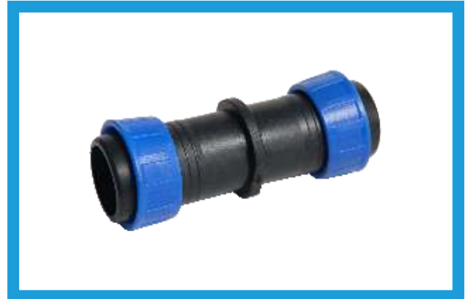
25X25 YÜZÜKLÜ EKLEME NİPELİ TAPE (WITH RING) NIPPLE VST42210121