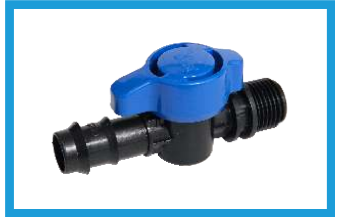
20* 1/2 KURTAĞZI DIŞ DIŞLI MİNİ VANA