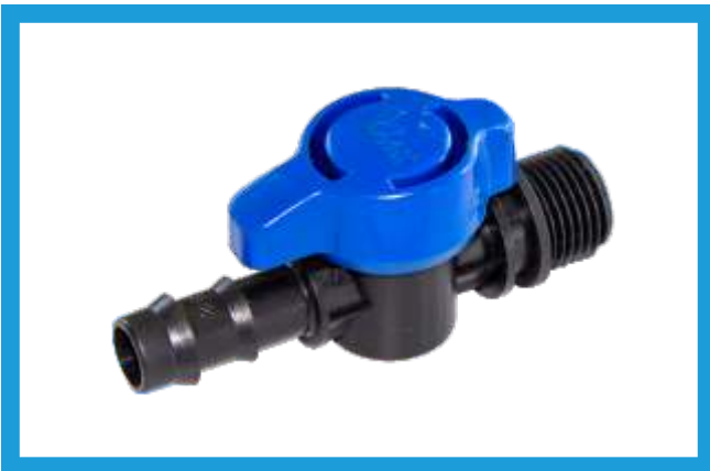
16X1/2 KURTAĞZI DIŞ DIŞLI MİNİ VANA