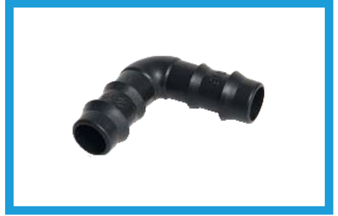
16X16 KURTAĞZI DİRSEK BARBED ELBOW VST42210181