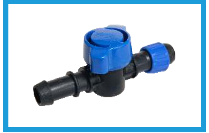
17X16 YÜZÜKLÜ CONTA ÇIKIŞ MİNİ VANA