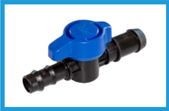
20X16 KURTAĞZI CONTA ÇIKIŞI MİNİ VANA