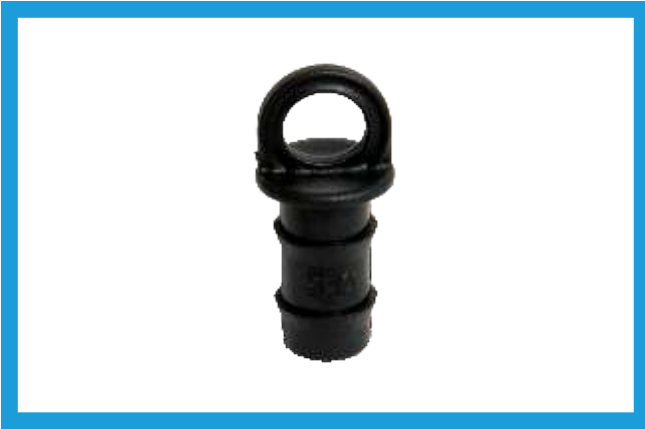
16 MM KURTAĞZI KÖR TAPA BARBED END CAP VST42210173