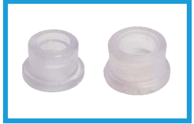
16 -20 MM DÜZ NATUREL CONTA CONNECTOR RING VST42210198 - 16 mm | VST42210201 - 20 mm