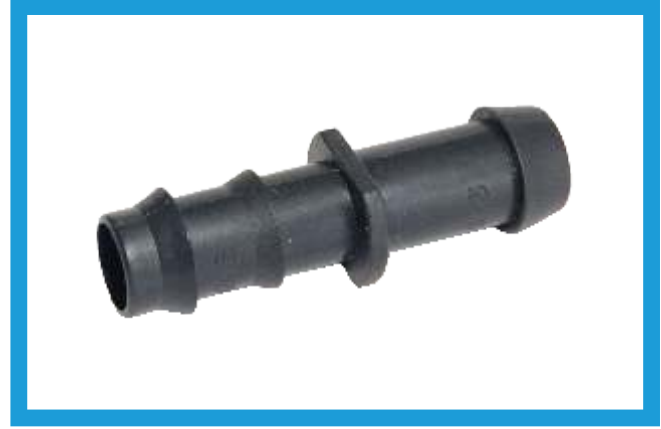
16X16 KURTAĞZI CONTA ÇIKIŞ EKLEME NİPELİ BARBED WITH GASKET NIPPLE VST42210205