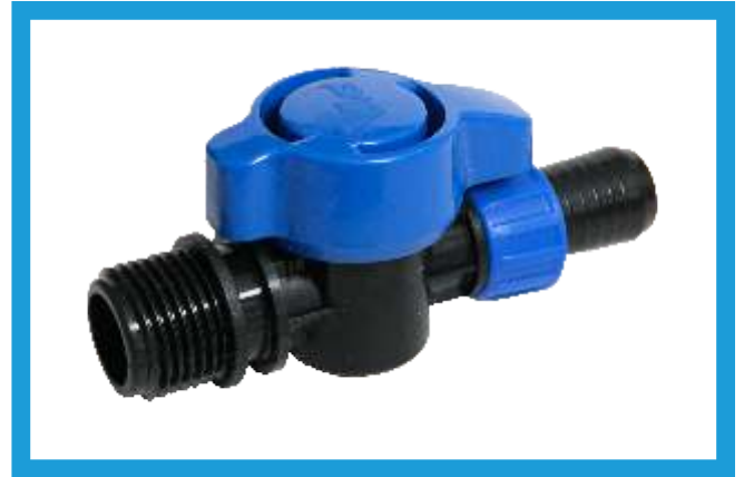
17" 1/2 YÜZÜKLÜ DİŐ DİŐLİ MİNİ VANA MINI VALVE THREAD MALE WITH RING VST42210041