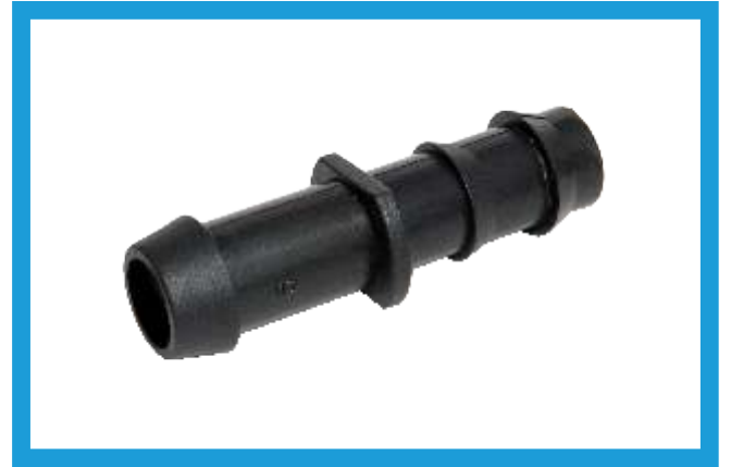
16X16 KURTAĞZI CONTA ÇIKIŞ EKLEME NİPELLİ BARBED WITH GASKET NIPPLE VST42210171