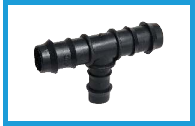
20X16X20 KURTAĞIZLI TE BARBED TEE VST42210179