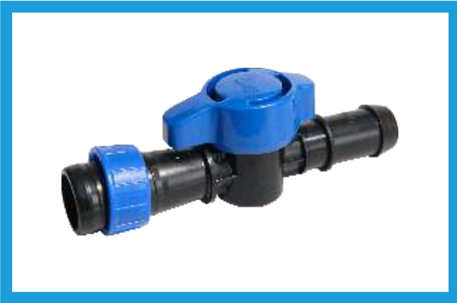
22X20 YÜZÜKLÜ CONTA ÇIKIŐ MİNİ VANA MINI VALVE OFF TAKE WITH RING VST42210083