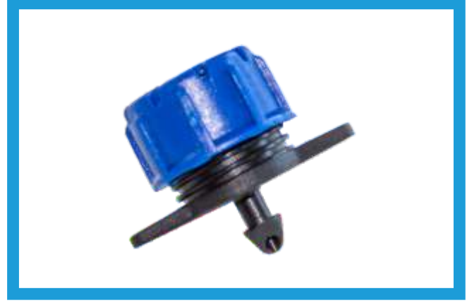
DEBİ AYARLI DAMLATICI (BÜYÜK MAVİ) ADJUSTABLE DRIPPER VST42210208