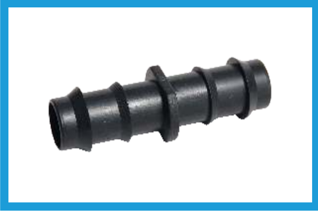
20X20 KURTAĞZI EKLEME NİPELİ BARBED NIPPLE VST42210170