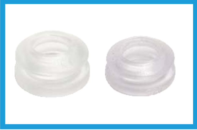
16 -20 MM KANALLI NATUREL CONTA CONNECTOR STOPPER RING VST42210196 - 16mm | VST42210197 - 20 mm