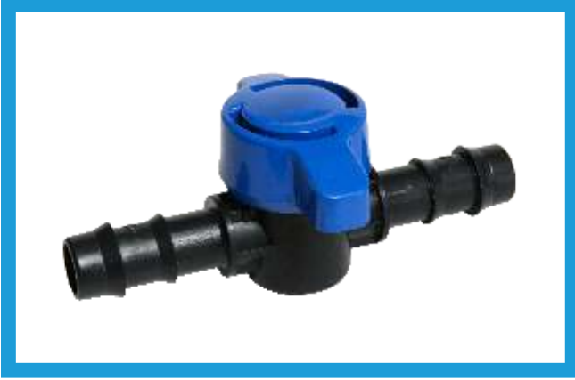
16X16 KURTAĞZI MİNİ VANA