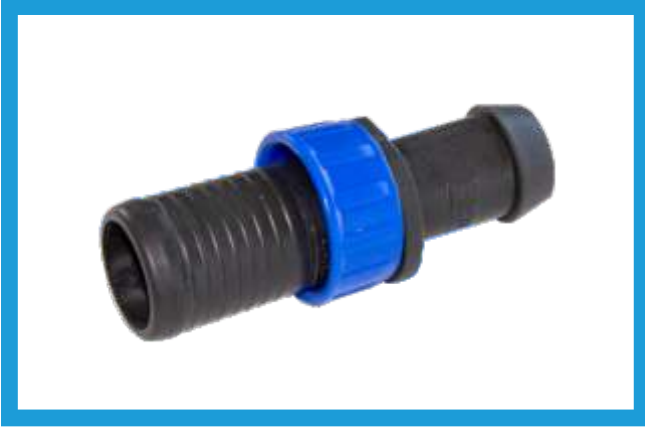
22X20 YÜZÜKLÜ CONTA ÇIKIŞ EKLEME NİPELLİ TAPE (WITH RING) OFFTAKE VST42210123