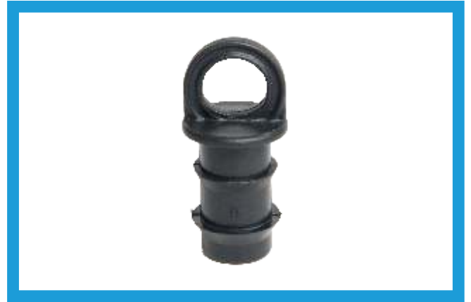
20 MM KURTAĞZI KÖR TAPA BARBED END CAP VST42210174