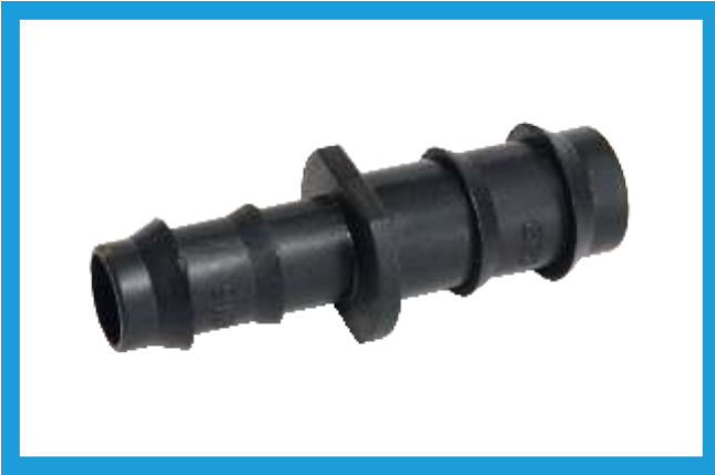
20X16 KURTAĞZI EKLEME NİPELLİ BARBED NIPPLE VST42210169