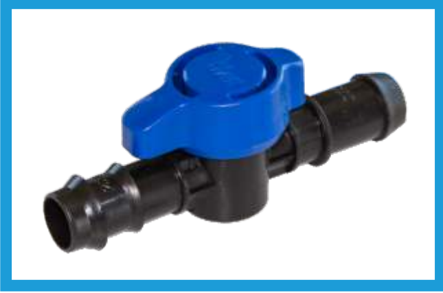
20X20 KURTAĐZI CONTA ÇIKIŐI MİNİ VANA MINI VALVE BARBED OFF TAKE VST42210028