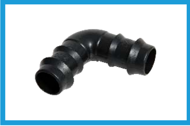
20X20 KURTAĞZI DİRSEK BARBED ELBOW VST42210182