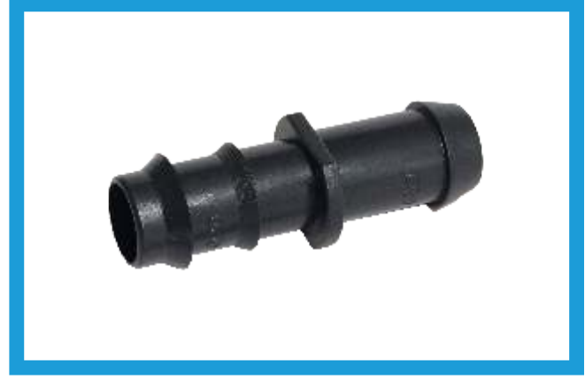
20X20 KURTAĞZI CONTA ÇIKIŞ EKLEME NİPELİ BARBED WITH GASKET NIPPLE VST42210172