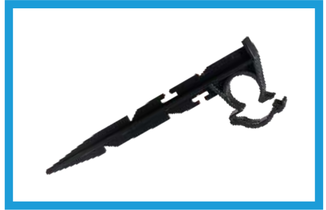
KLİPSLİ SABİTLEME KAZIĞI KISA CLIPS PIPE STABILIZER SHORT VST42210204