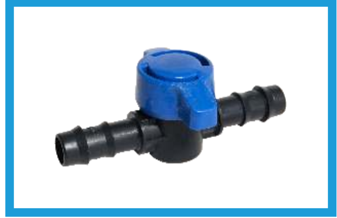
16X16 KURTAĞZI MİNİ VANA BARBED MINI VALVE VST42210023