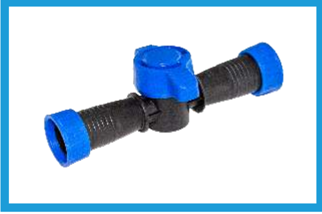
17X16 YÜZÜKLÜ MINI VANA MINI VALVE WITH RING VST42210122