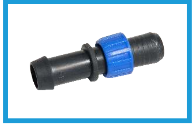
20X22 YÜZÜKLÜ CONTA ÇIKIŞ EKLEME NİPELLİ TAPE (WITH RING) OFF TAKE VST42210092