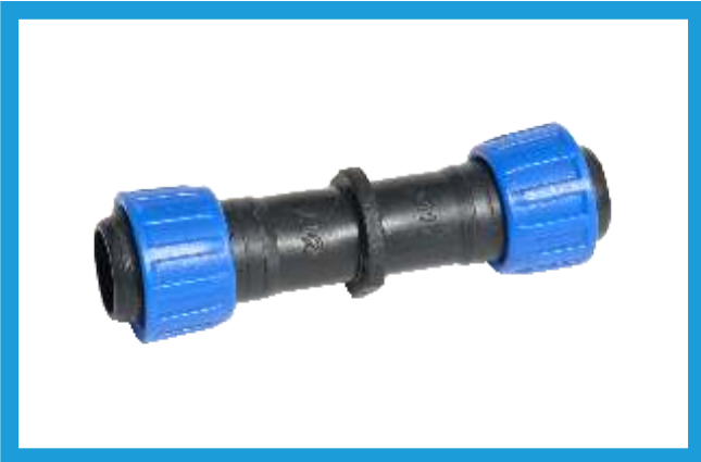
17X17 YÜZÜKLÜ EKLEME NİPELİ TAPE (WITH RING) NIPPLE VST42210119