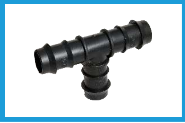
20X20X20 KURTAĞZI TE BARBED TEE VST42210180