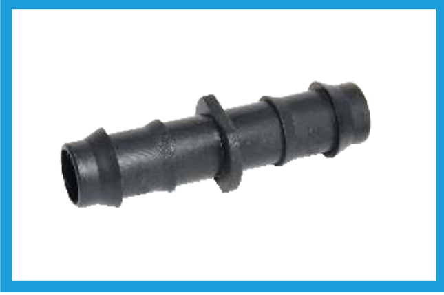
16X16 KURTAĞZI EKLEME NİPELİ BARBED NIPPLE VST42210168