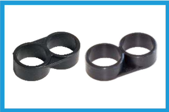
16 -20 MM GÖZLÜK TAPA FIGURE 8 END CLAMP VST42210175 - 16 mm | VST42210176 - 20 mm