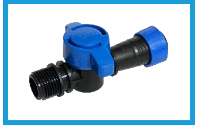
22" 1/2 YÜZÜKLÜ DİŐ DİŐLİ MİNİ VANA MINI VALVE THREAD MALE WITH RING VST42210087