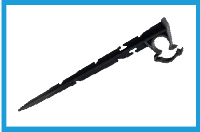
KLİPSLİ SABİTLEME KAZIĞI UZUN CLIPS PIPE STABILIZER LONG VST42210203