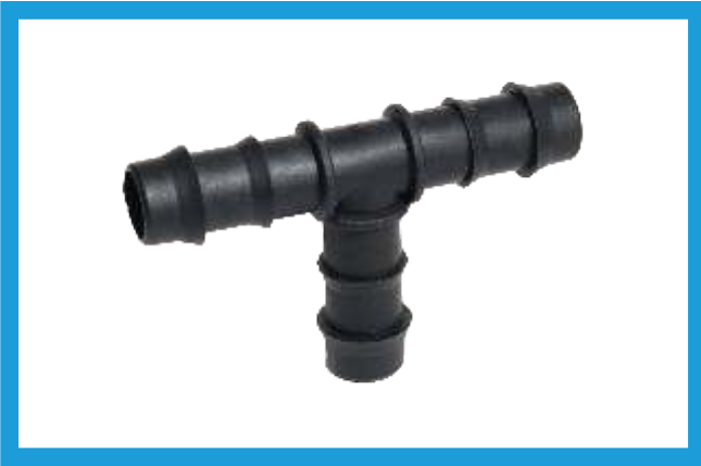
16X16X16 KURTAĞIZLI TE BARBED TEE VST42210177