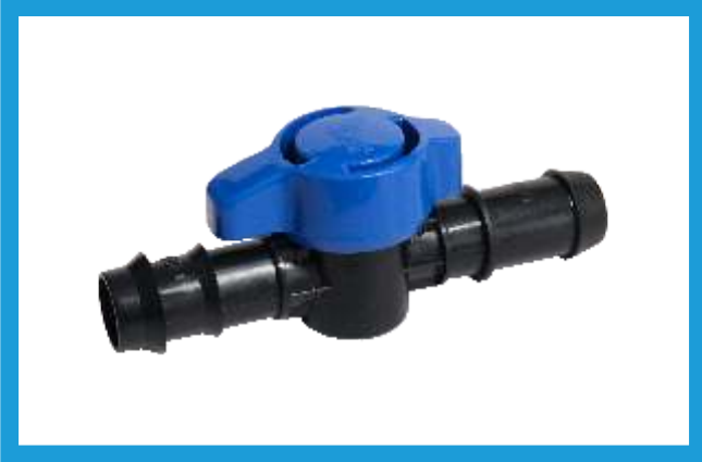
20X20 KURTAĞZI CONTA ÇIKIŞ MİNİ VANA MINI VALVE BARBED OFF TAKE VST42210052