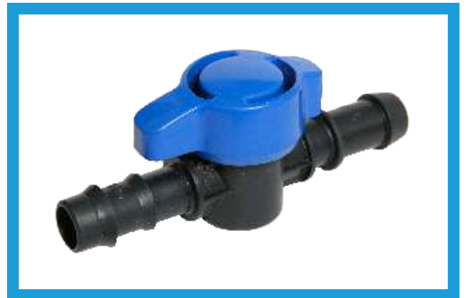
16X16 KURTAĞZI CONTA ÇIKIŞ MİNİ VANA