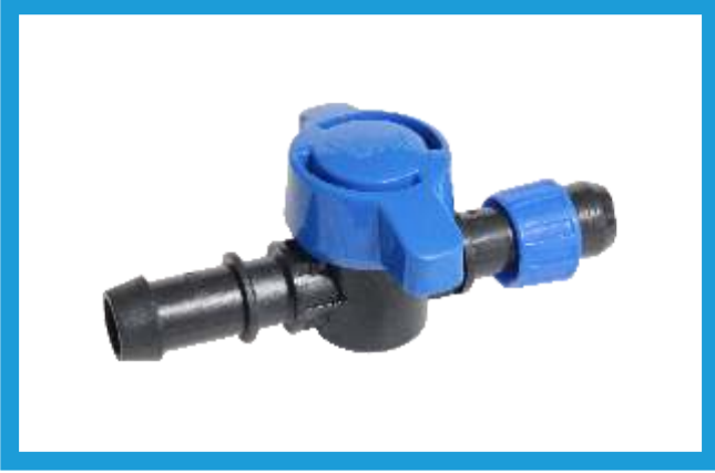
17X16 YÜZÜKLÜ CONTA ÇIKIŞ MİNİ VANA MINI VALVE OFF TAKE WITH RING VST42210081