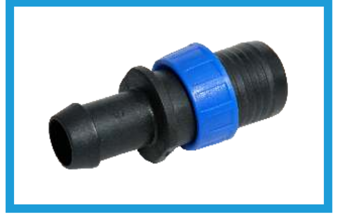
25X20 YÜZÜKLÜ CONTA ÇIKIŞ EKLEME NİPELLİ TAPE (WITH RING) OFFTAKE VST42210124